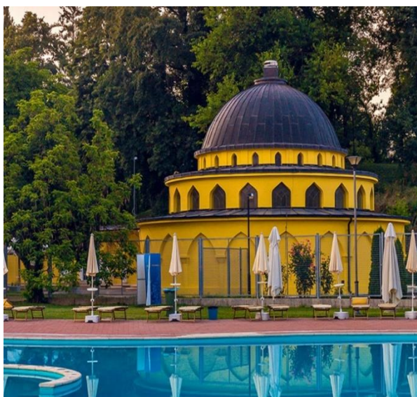
Здравствено-туристички комплекс „Терме Лакташи“