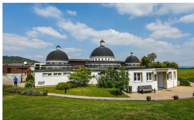
Бања Слатина, саставни дио Завода за физикалну медицину и рехабилитацију „Др Мирослав Зотовић“ Бања Лука